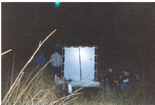
Sortie nocturne en BRENNE

L'association est largement ouverte à tous : débutants, amateurs éclairés ou spécialistes.