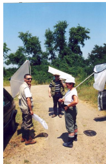
Départ pour une prospection