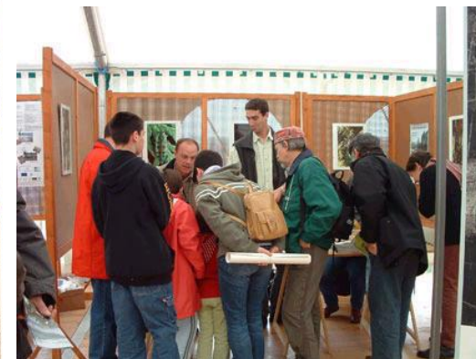
Animation grand public